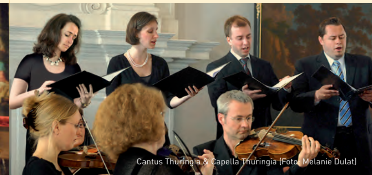
Cantus Thuringia & Capella Thuringia