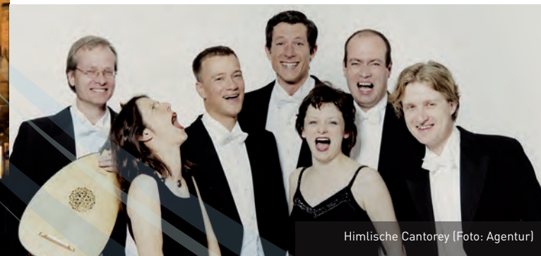
Himlische Cantorey